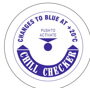
Înainte de activare

Notă: Etichetele Chillchecker ar trebui să fie depozitate în mod ideal sub temperatura lor limită în permanență, și dacă se face acest lucru, ele pot fi scoase din depozitul frigorific, aplicate direct pe un produs răcit în prealabil și activate. Dacă produsul nu este răcit, unitatea se poate activa.